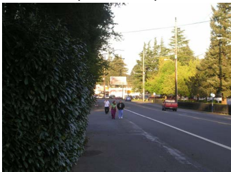
Con $50,000 se dio inicio a un proyecto de planificación de mejoras en Powell Blvd., cantidad que fue suplementada por una subvención de $330,000 del ODOT