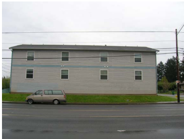
Planes para la 122 nd Avenida para crear un vecindario más práctico para peatones ($30,000)