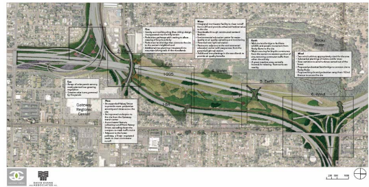
Planes para el desarrollo de los espacios públicos (I-205/I-84) a través del plan "Gateway Green" ($45,000)