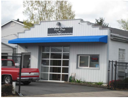
Se amplió el programa de mejoramiento de fachadas de negocios ($115,000)