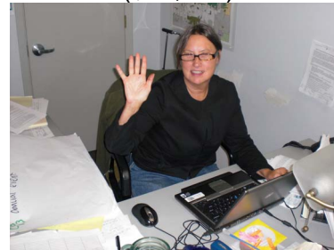
Se contrató a una Representante del EPAP para que apoye la implementación de proyectos ($125,000)