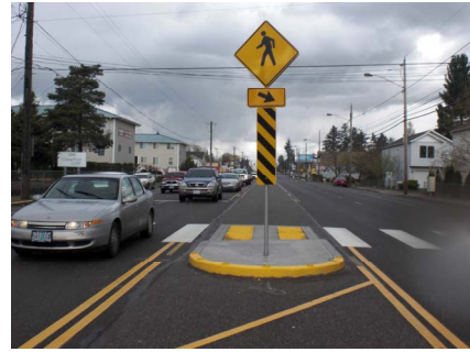
Se implementaron mejoras relativas a Rutas Seguras a la Escuela + Seguridad Vial ($60,000)